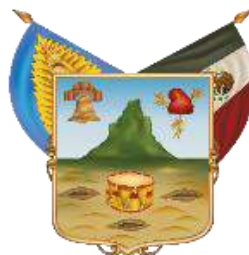
Estado Libre y Soberano de Hidalgo